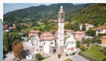
Sotto il Monte Giovanni XXIII