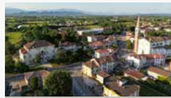
Riese Pio X